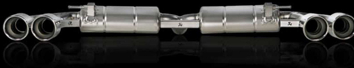
Audi TTS Slip-On System

Hardfacts: Titanium, 3.4 PS plus, 5.3 Nm plus, 7.8 kg minus